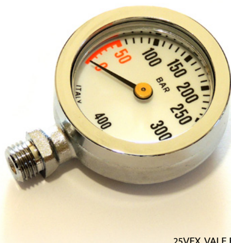
25VEX VALE EXTREME Mini Manometro completo

Mini manometro subacqueo professionale brevettato caratterizzato da una linea pulita ed essenziale, cassa monoblocco in ottone diametro 50 mm con nuova ghiera sovradimensionata in ottone con spessore di parete di 3 mm entrambe lavorate a controllo numerico e cromate, vetro minerale temperato antigraffio, spessore 5 mm.