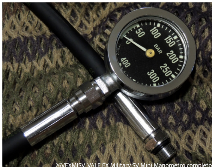
26VEXMISV VALE EX Military SV Mini Manometro completo