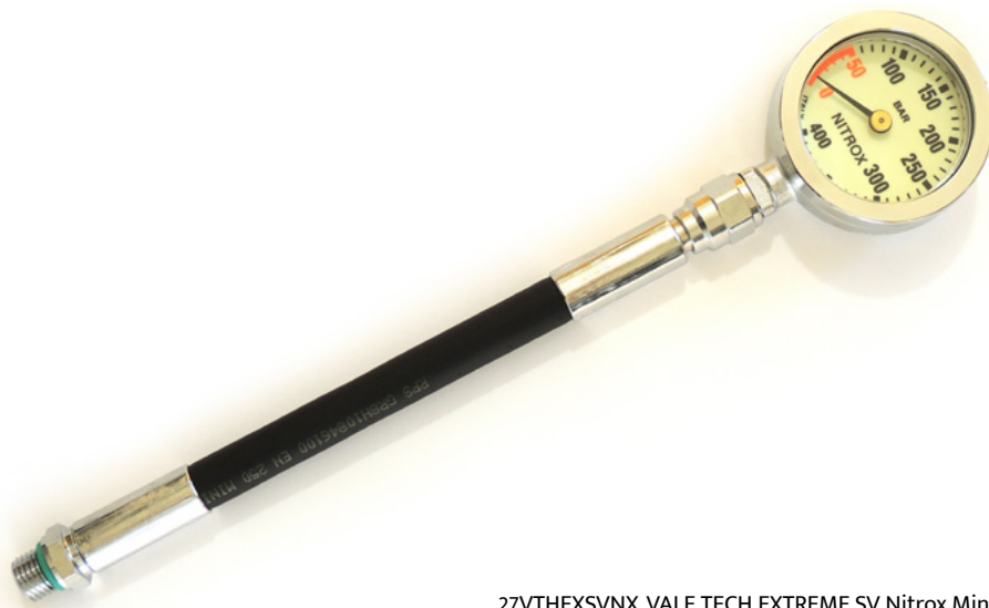
27VTHEXSVNX VALE TECH EXTREME SV Nitrox Mini Man. compl.

VALE TECH EXTREME frusta 18 cm / hose 18 cm