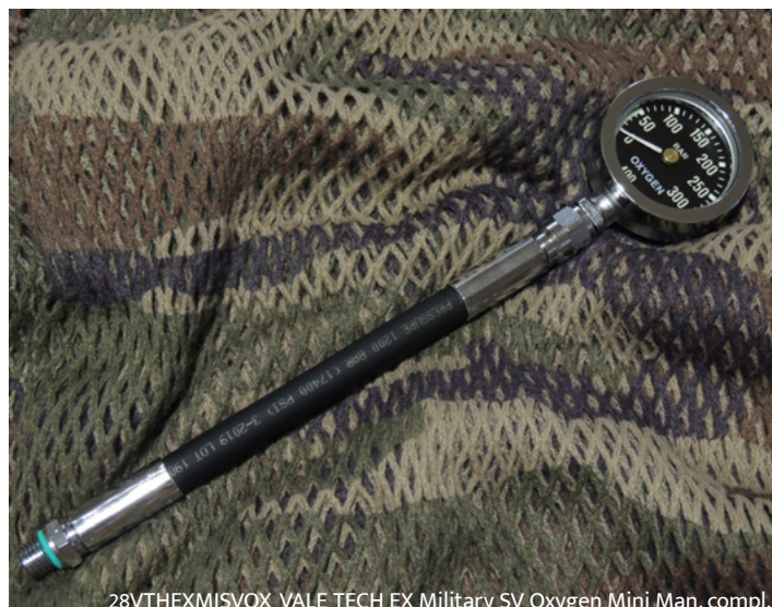
28VTHEXMISVOX VALE TECH EX Military SV Oxygen Mini Man. compl.